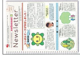
Newsletter Vol. 2