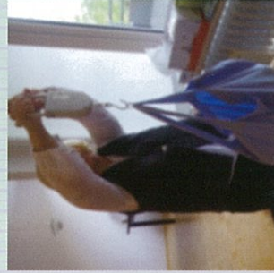
自宅訪問専門のベバメ

C: 日本でも保健師が訪問する制 度はありますが少し違いますね。 自分で担当を選べて、しかも 無料！というところがいいで すね。