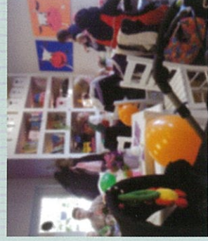
ドイツの「ママカフェ」の様子 パパの姿も...

A: 産前・産後の2〜3ヶ月の 産間、自宅を訪問し、赤ちゃんを 授乳についてのほか、ママの体 調 (血圧・会陰部の状態など) も診てくれます。