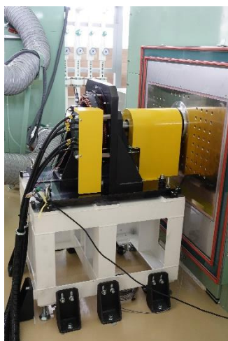
※ハルバツハモーター（横から見た写真。カバー有）

ハルバツハモーターとは、永久磁石をハルバツハ配列に基づき配置することで磁石の利用効率を最大化し、 大出力(高効率)化、小型化、軽量化 が期待できるモーターのことです。