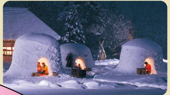
秋田の伝統行事「横手かまくら」