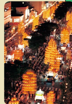
東北4大祭り「竿燈まつり」で 夜空に輝く光の稲穂