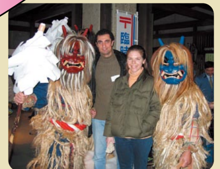
秋田の伝統行事「なまはげ紫灯まつり」で なまはげと記念撮影