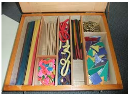
フレーベル 第七～第十三 恩物