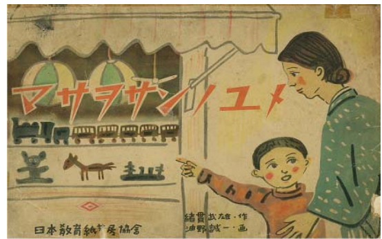
かみしばい 昭和19年