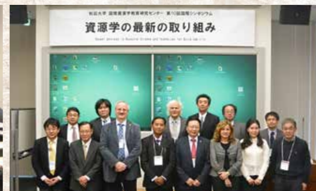
講演者及び関係者の記念撮影